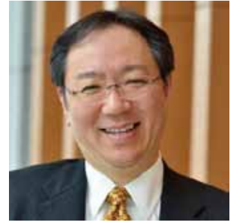
神戸大学大学院 経営学研究科 教授